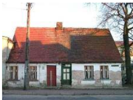
Dům v Kosynierówě ulici před modernizací

Uvedená iniciativa přináší výsledky a tak byla převzata společně samosprávou města Ustka a Ustským domovním sdružením (v polštině zvaném „UTBS“). Obec předala sdružení dva obecní bytové domy umístěné v ul. 13 Kosynierówě (207 m 2 ) a pět v ul. Findera (284 m 2 ). Budovy vyžadovaly vlivem nedostatečného technického stavu kompletní rekonstrukci.