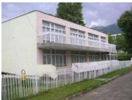
Mateřská škola "Purvi Juni" před modernizací

V přípravě energetických auditů bylo kalkulováno, že všechny mateřské školy budou hradit € 177,948 ročně za energetickou spotřebu 2,503 MWh.