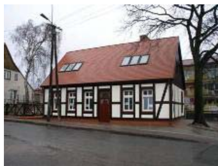
Dům v Kosynierówě ulici po modernizaci