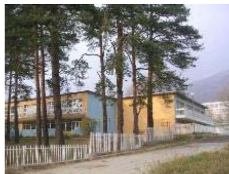
Mateřská škola "Purvi Juni" po modernizaci

Sjednaná investice € 855,747 byla zajištěna ESCO společností pro všechny mateřské školy. Doba jejich návratnosti byla vykalkulována na 5,8 roku. Roční spotřeba energie pro 5 budov po uskutečnění energeticky úsporných opatření je projektována na 900 MWh ročně tj. o 36 %